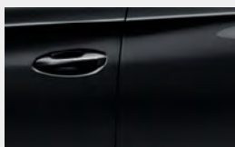
Silver Sand Black