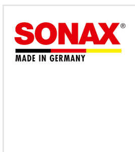
Sonax Profiline Hybrid Coating CC One