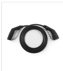
Laadkabel type 2 mode 3 (max 32 A / 1 fase) - 7,5 m.